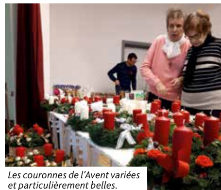
Les couronnes de l'Avent variées et particulièrement belles.