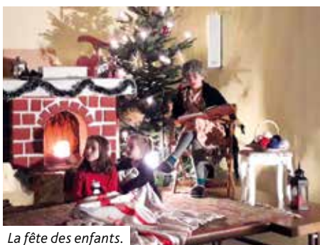
La fête des enfants.