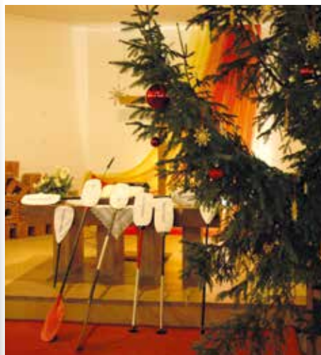
Un temps fort œcuménique avec le curé Johan Begliuomini à l'occasion de la semaine de prière pour l'unité de tous les chrétiens.