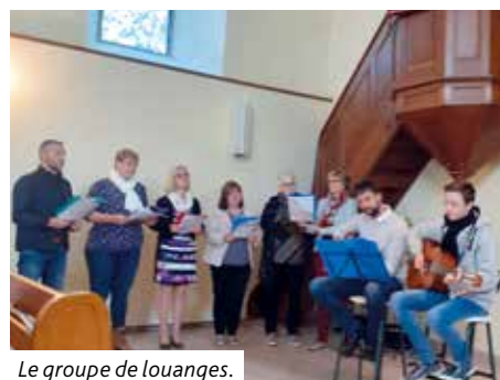
Le groupe de louanges.