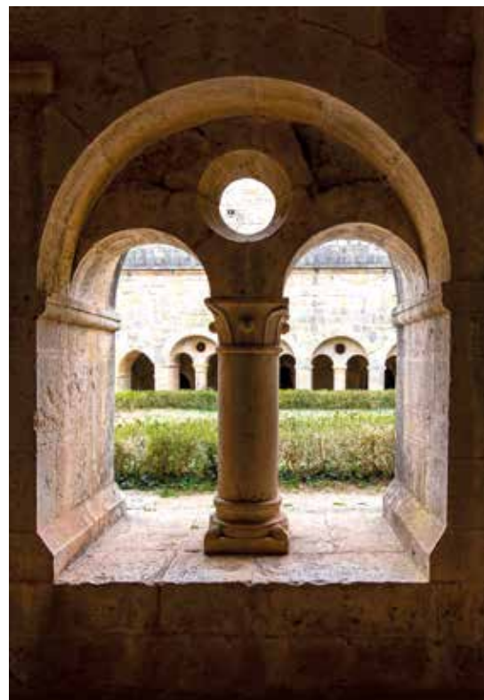
Aller à la source.

Ne soyez inquiets de rien, mais en toute circonstance, dans l'action de grâce, priez et suppliez pour faire connaître à Dieu vos demandes.