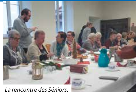
La rencontre des Séniors.

Le groupe de louange accompagne les cultes de famille.