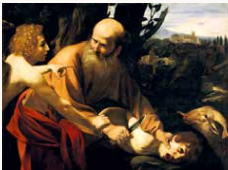
Le Sacrifice d'Isaac – Le Caravage (Uffizi).

Une initiative des paroisses catholique, protestante et évangélique de Wissembourg. Pour tous les âges. Avec audio-guides pour enfants/ados/adultes, en langue française. Description de 21 tableaux représentant des scènes bibliques (rappel du récit biblique et explications). On peut y venir avec des enfants de l'école du dimanche, du caté, groupes de jeunes, etc. Grange aux Dîmes de Wissembourg , libre participation aux frais.