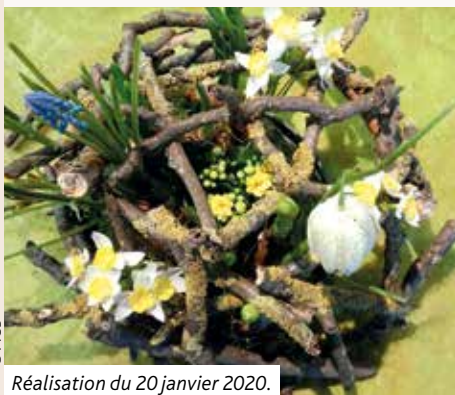
Réalisation du 20 janvier 2020.

Pour plus d'information, contacter M-Claude Bastian : m.claude.bastian@gmail.com 03 88 94 18 04