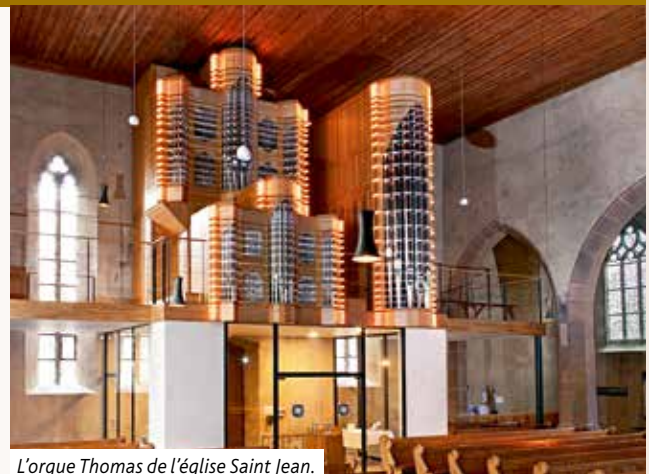
L'orgue Thomas de l'église Saint Jean.

Grâce à vous le financement de l'orgue Thomas est désormais finalisé. Merci beaucoup ! Nous invitons à l'assemblée générale de l'association des Amis de l'orgue Saint Jean le 4 mai à 20h au foyer Westercamp.