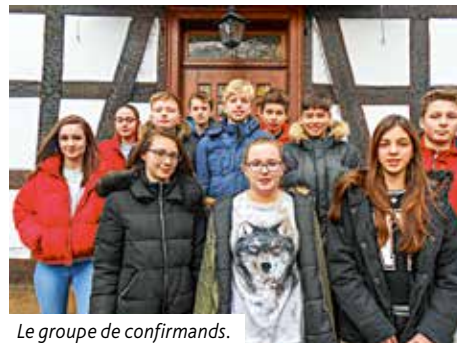
Le groupe de confirmands.