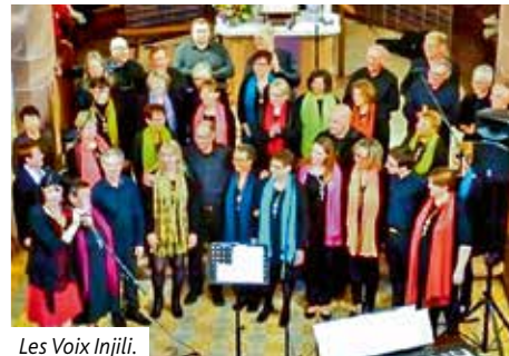
Les Voix Injili.