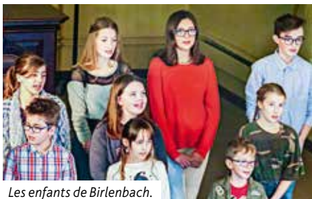
Les enfants de Birlenbach.

Nous remercions: les enfants, les moniteurs et les bénévoles pour tout le travail et le dévouement qui ont permis la réussite de ce temps fort pour la paroisse.