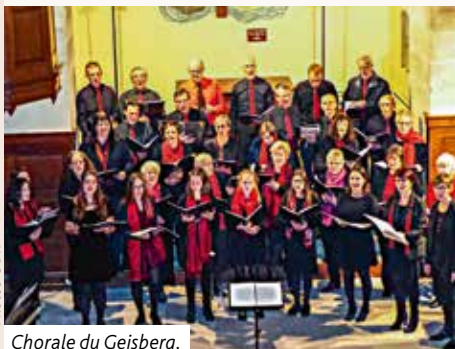
Chorale du Geisberg.

Merci de tout cœur pour votre présence et votre générosité.