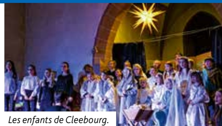
Les enfants de Cleebourg.

Un très grand merci pour toutes les personnes qui ont aidé à organiser les rencontres du temps de l'Avent à Cléebourg et Birlenbach: les conseillers presbytéraux, les bénévoles, celles et ceux qui ont confectionné couronnes de l'Avent, les bredle, l'aménagement des lieux, le rangement, les organistes, les musiciens, dont les cuivres d'église de l'Outre-Forêt, pour leur magnifique concert de Noël au profit de la rénovation de l'église de Cléebourg. Le bénéfice de la vente de l'Avent nous a permis de soutenir, entre autres, le Centre social protestant. La veillée des enfants à Cléebourg qui, elle aussi, a réussi à rappeler le message de Noël avec des actualisations très réussies. Bravo et merci pour ce formidable investissement. L'opération « Cœurs en fête » a rapporté